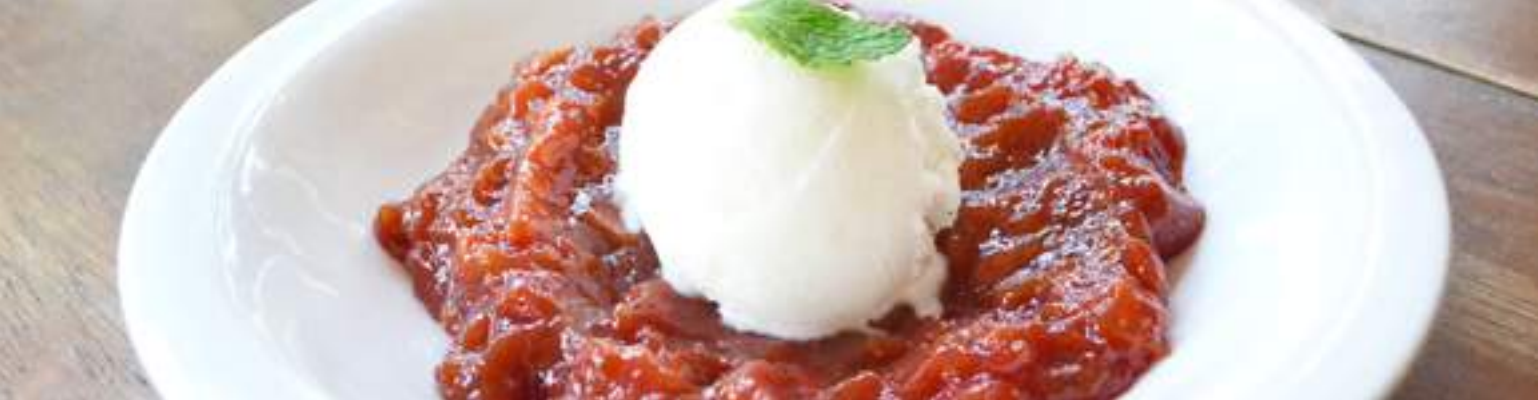
sorvete de queijo com goiabada