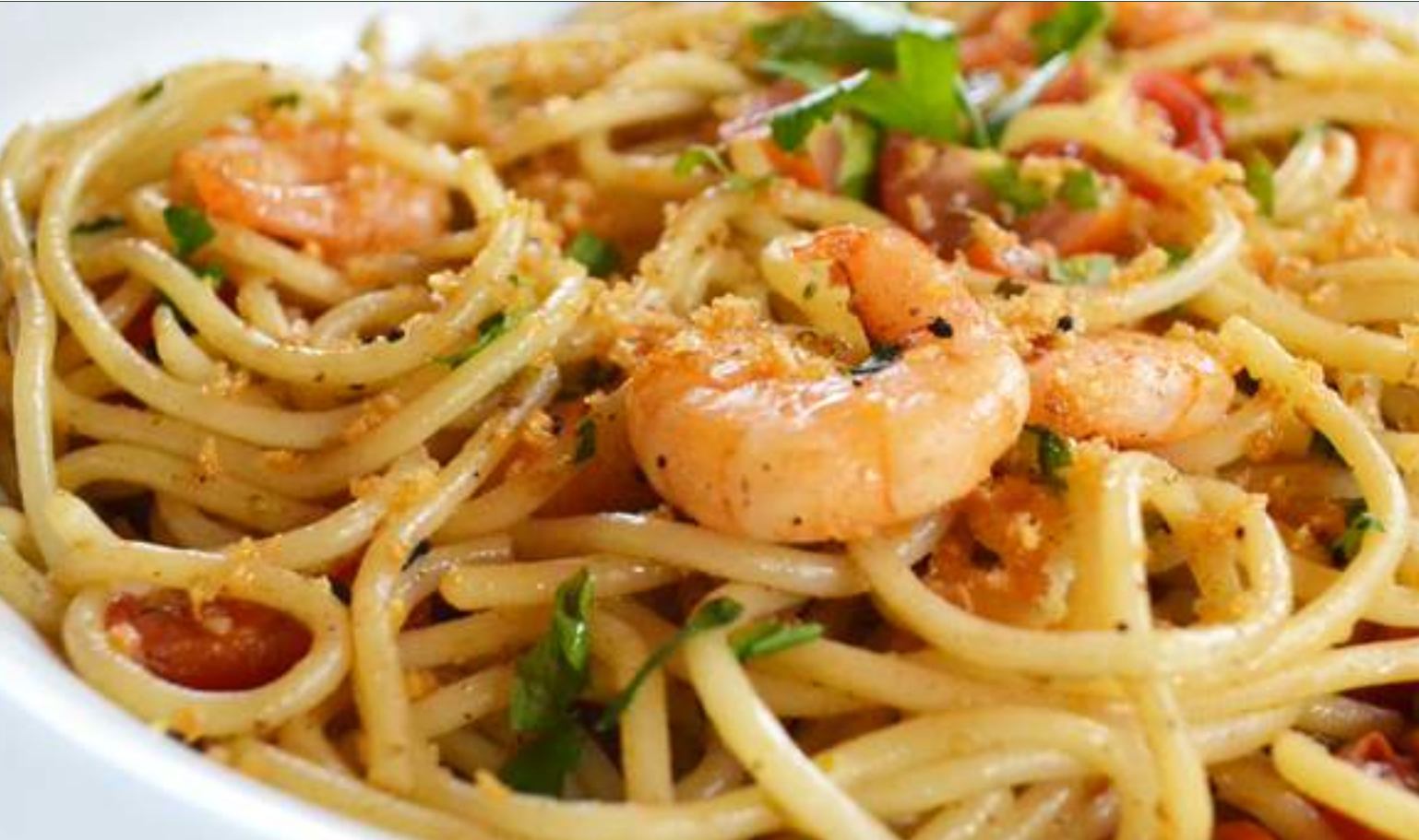
spaguetti com camarão