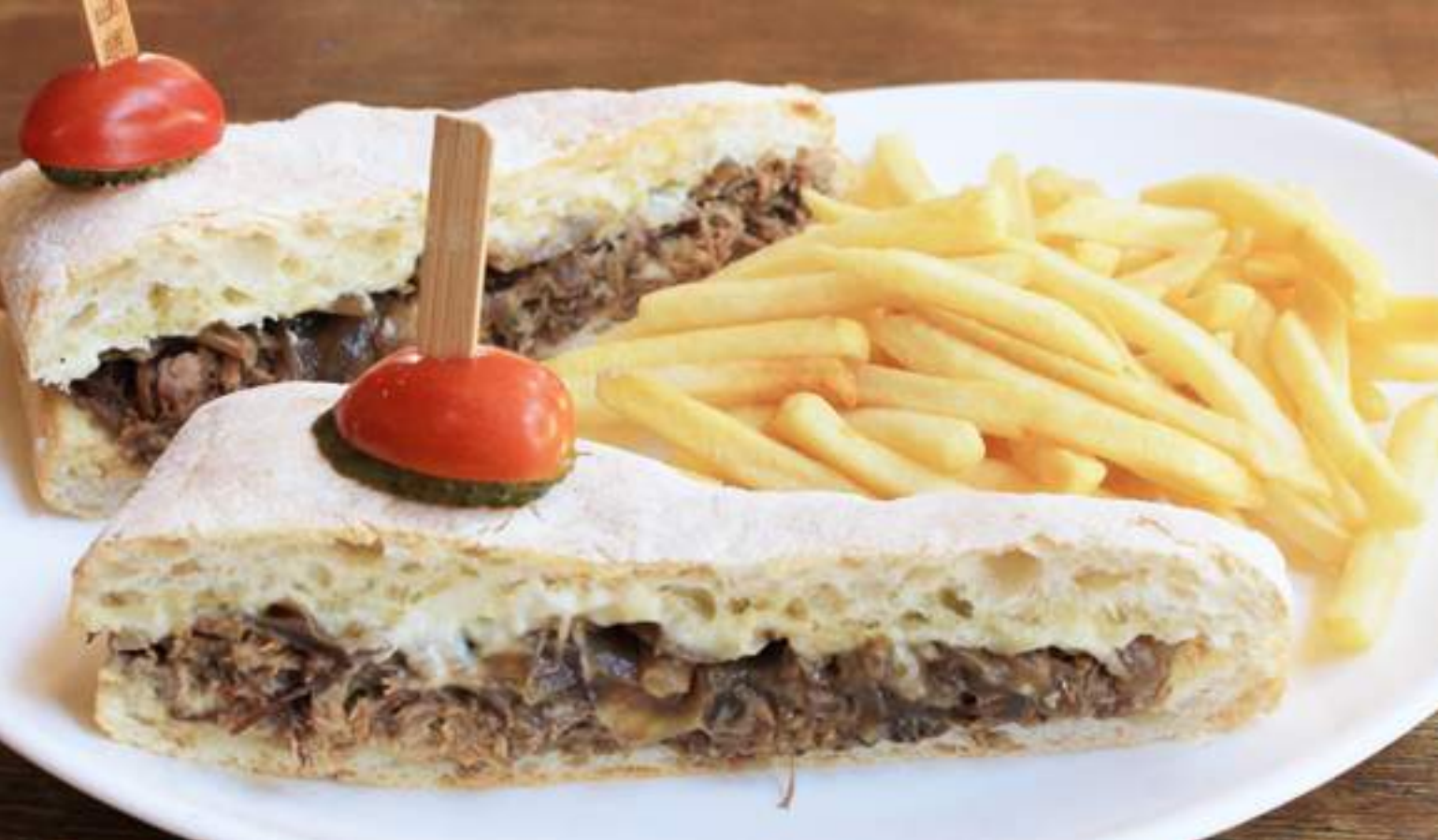
sanduíche especial: carne assada