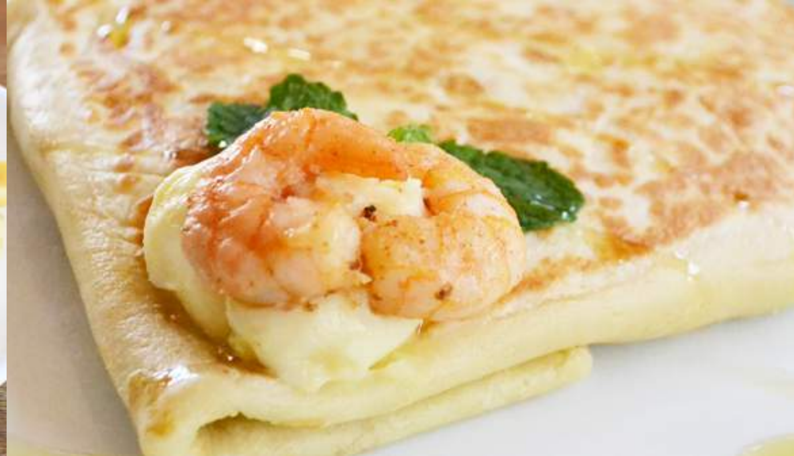
crepe de camarão com catupiry