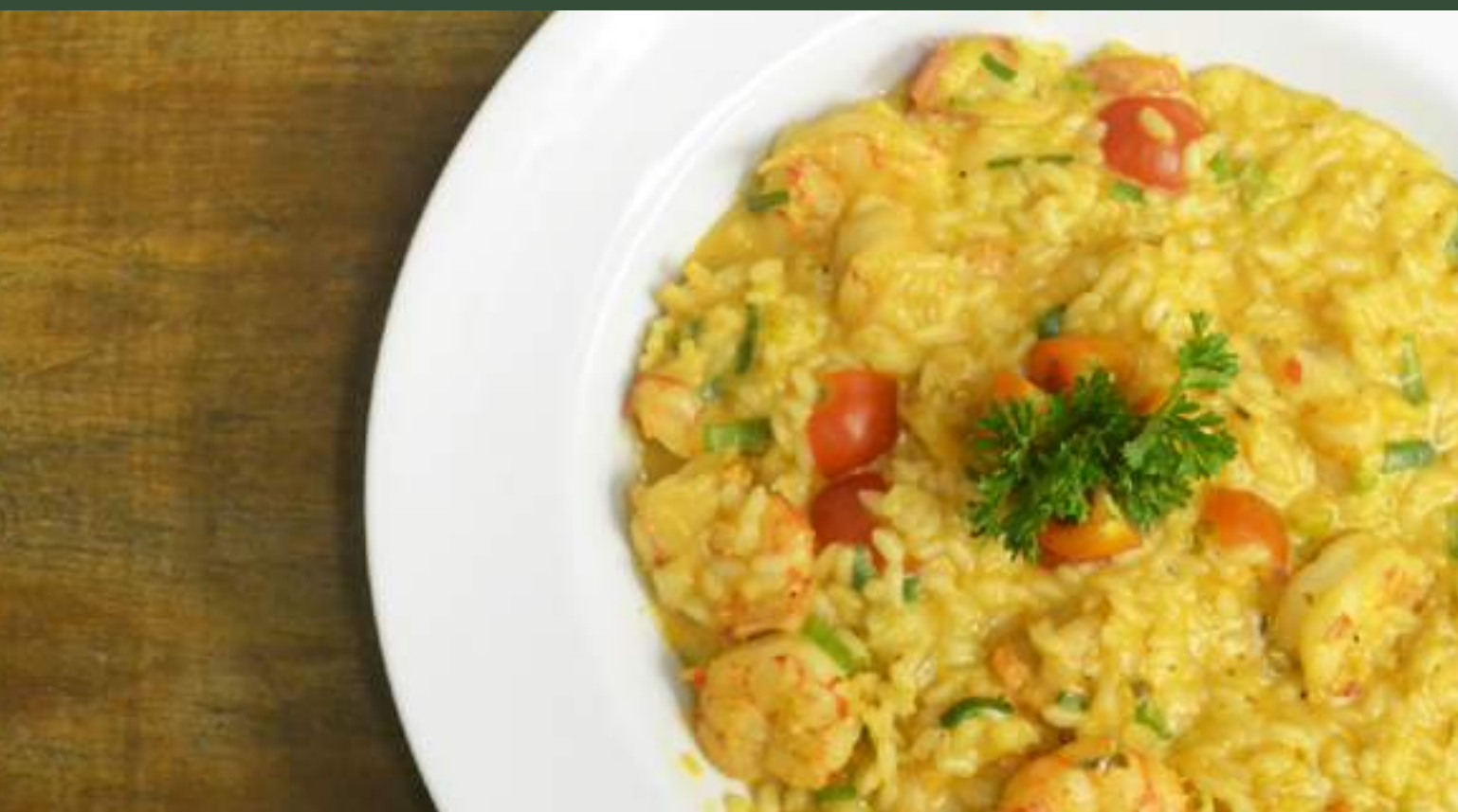
risoto de camarão