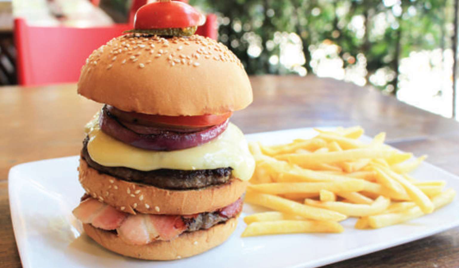
burguer especial: duplo asa gourmet